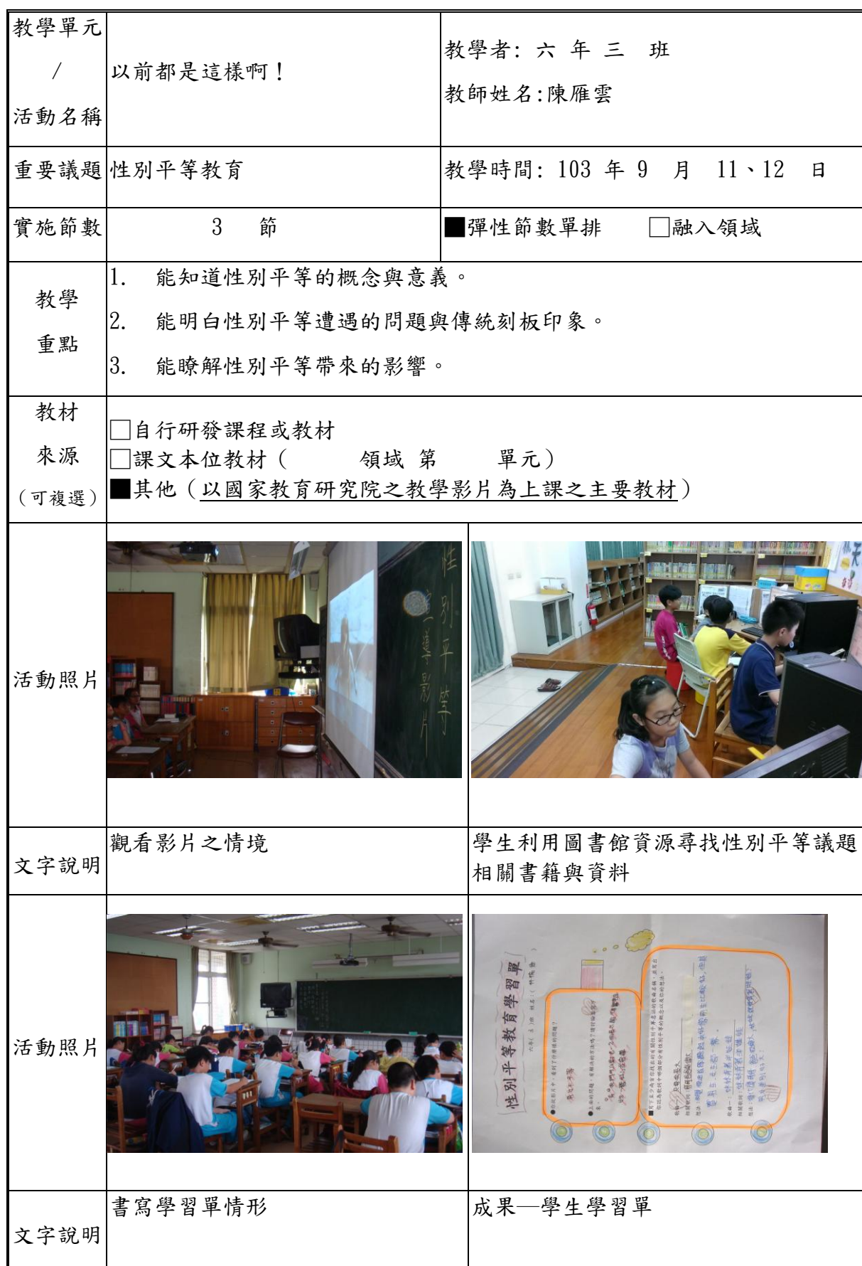
臺南市文化國小重要議題融入課程計畫教學成果摘述表